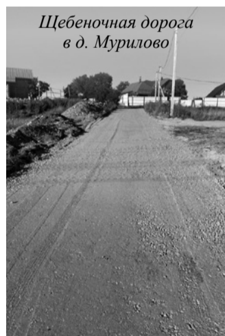
Щебеночная дорога в д. Мурилово

Также в деревне Малое Карлино для лучшей проходимости очищенных стоков увеличен диаметр канализационной трубы, идущей от очистных сооружений до точки сброса на рельеф.