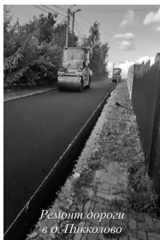
Ремонт дороги в д. Пикколово