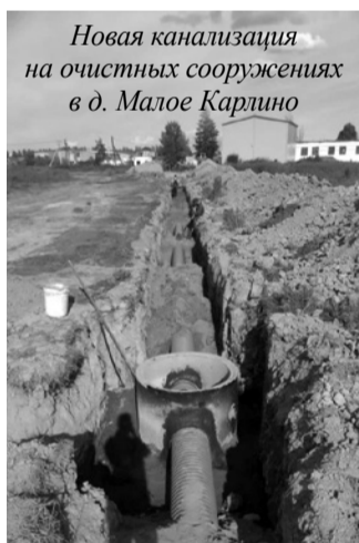
Новая канализация на очистных сооружениях в д. Малое Карлино